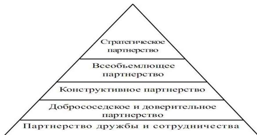
Рис. 1. Условная иерархия китайских партнерств. 12

Анализ применения термина «стратегическое партнерство» по отношению к Беларуси китайскоязычными интернет-СМИ обнаруживает, что подобные сообщения передают слова