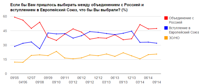
Диаграмма 2. Динамика геополитических ориентаций белорусов

Согласно исследованиям НИСЭПИ, количество белорусов, которые ориентируются на Россию и Европу, на протяжении последних 5 лет остается примерно равным. Поддержка проевропейского и пророссийского курса колеблется на уровне 40-45%. Разрыв между ними растет только в периоды крупных международных конфликтов, таких как российско-грузинская война или конфликт на Донбассе. Тогда снижается поддержка Европы и растет количество людей, симпатизирующих России 13 . Исследования компании «НОВАК», в свою очередь, показывают, что поддержка союза с Россией с сентября 2013 г. по сентябрь 2014 г. возросла с 51% до 64% 14 .