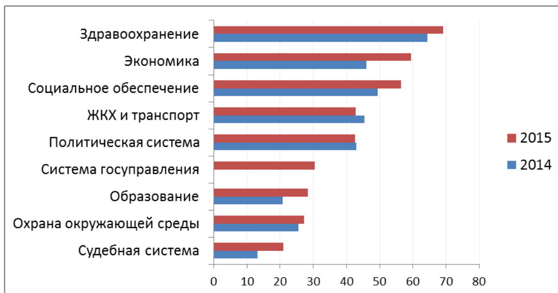
Диаграмма 4. Доля белорусов, которые выступают за срочные реформы (ближайшие 1-2 года) в той или иной сфере

Поддержка населения – важный компонент успешной реализации реформ правительством. Данные национального опроса в рамках проекта РЕФОРУМ показывают большой интерес белорусов в безотлагательном реформировании приоритетных сфер – экономики в целом, системы социального обеспечения, здравоохранения, ЖКХ и транспорта, системы государственного управления. Анализ данных показывает, что настроения в обществе благоприятны для начала проведения реформ.