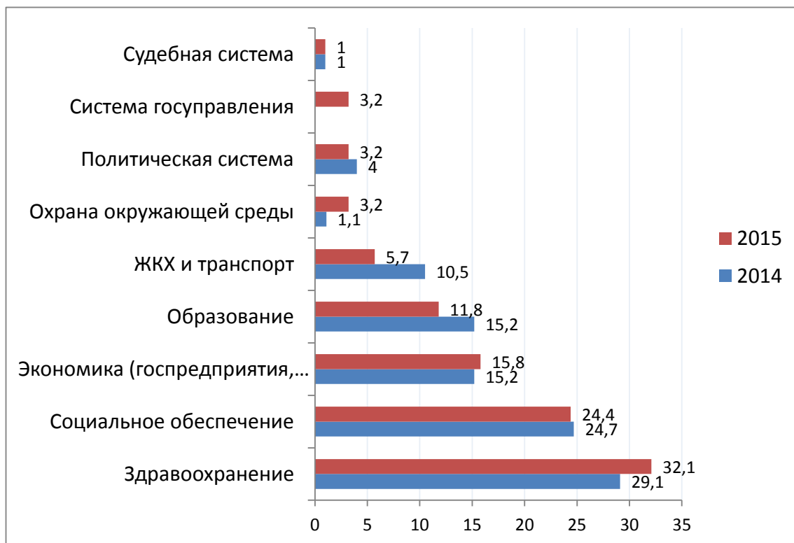
Диаграмма 1. Доля респондентов, которые отдают приоритет определенной сфере общественной жизни с точки зрения собственных интересов и благополучия

Мужчины чаще за экономику, а женщины заметно чаще за соцобеспечение.